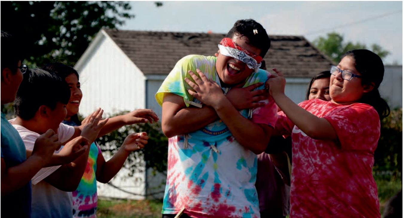
Jóvenes en el programa extraescolar de La Esperanza aprenden sobre confianza y liderazgo.

Esperamos poder trabajar juntos con diversos líderes comunitarios y colaboradores para aprender de este estudio, crear oportunidades para todos y garantizar el continuo crecimiento y éxito de nuestras comunidades.